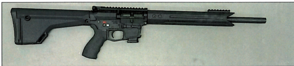
Abbildung 2: „Swiss Pistol Carbine SPC-Sporter-EU“, Ansicht rechte Seite

Die neu zu beurteilenden Lauflängen der Schusswaffen „Swiss Pistol Carbine SPC-Sporter-EU“ und „Swiss Pistol Carbine SPC-Sporter“ und die sich daraus ergebenden Waffenlängen sind aus der folgenden Tabelle ersichtlich: