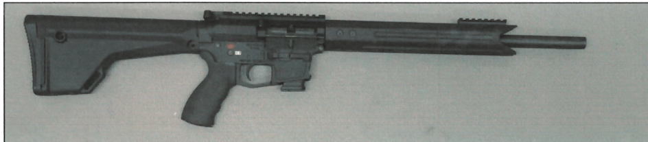
Abbildung 2: „Swiss Pistol Carbine SPC-Sporter-EU“, Ansicht rechte Seite

Die Musterwaffe ist eine Neufertigung der Firma GWM+H AG - Glarner Waffen Manufaktur + Handelshaus AG -, Dorfstraße 28, CH-8782 Rüti-GL, Schweiz.