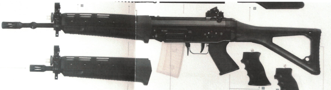
Abbildung 4: „SIG551 LB Zivil Sport“, Ansicht linke Seite (Auszug aus einem Prospekt, relevant ist nur der montierte längere Lauf)

Da die Unterschiede der in der obigen Tabelle genannten Schusswaffen lediglich in der Lauf­länge und daraus resultierend in der Gesamtlänge liegen, werden in der nachstehenden Beurteilung alle oben genannten Waffenmodelle erfasst. Die bei den Schusswaffen „SAN SIG 550 Zivil Sport“ und „SAN SIG 551 LB Zivil Sport“ auf den Bildern sichtbaren „Knoten“ auf den Läufern weichen technisch und funktional von dem „Knoten“ der Kriegswaffe ab und sind nicht für das Verschießen von Granaten bestimmt. Diese stellen lediglich ein optisches Feature dar.