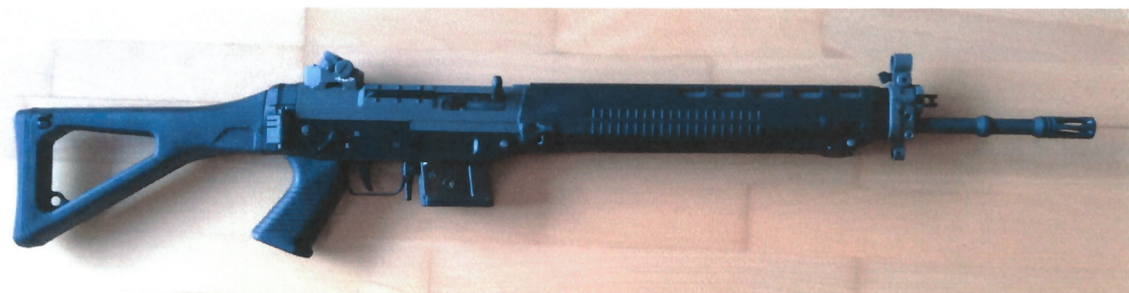
Abbildung 3: „SIG550 Zivil Sport“, Ansicht rechte Seite