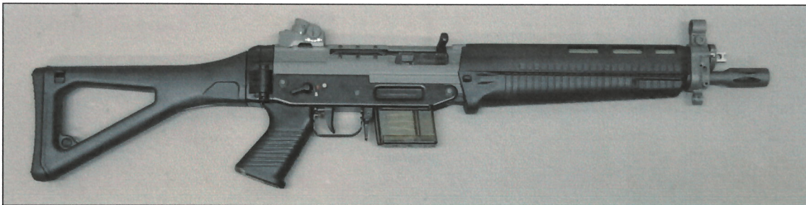
Abbildung 2: „SG551-1 SP SWAT“, Ansicht rechte Seite

Die Musterwaffe ist die halbautomatische Variante der „SG551-1 SWAT“ der Firma SAN Swiss Arms AG, Schweiz.