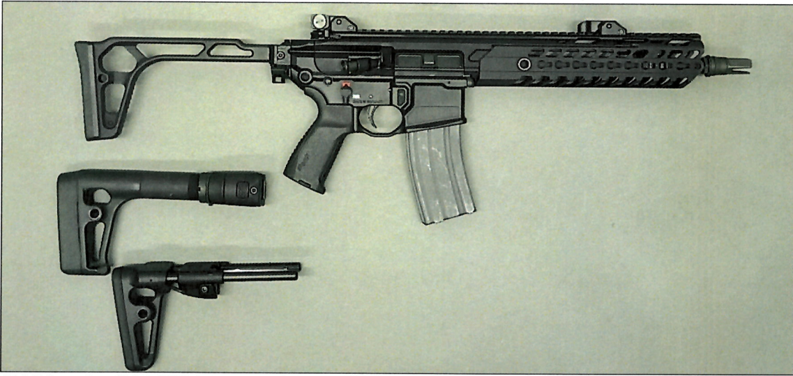
Abbildung 2: „SIG MCX Sport“, Ansicht rechte Seite und weitere Schulterstützenvarianten

Die Waffe ist eine eigene Fertigung. Die Waffe basiert in ihrer Funktionsweise grundsätzlich auf dem Colt „AR15“-System.