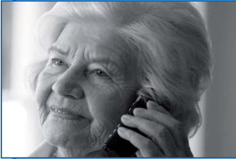
Bundeskriminalamt Projektgruppe „Call-Center-Betrug“