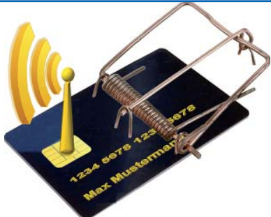
Kriminaltechnische Untersuchung im Bereich der IuK-Forensik