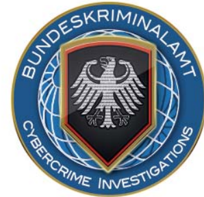
Cybercrime - Zentralstelle Operative Auswertung