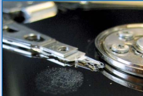
Forensische Auswertung von Datenträgern