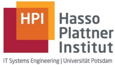
Hasso Plattner Institut